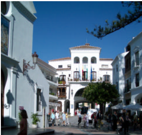
Imagen del centro de Nerja

Por la noche nos encontrábamos para ir juntos a cenar. Después íbamos a un bar con música en directo y terminábamos en la plaza Tutti-Frutti. Las dos semanas pasaron muy rápido. Envidiaba a toda la gente que podía quedarse más tiempo o los que volvieron al año siguiente. En el autobús lloré mientras escuchaba la cinta que había comprado en el bar. Estaba enamorada de Nerja.