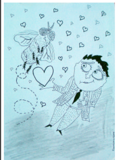
Ilustración de Francisco Naranjo

El hombre estaba muy enojado porque la mosca no quería casarse con él. Por eso él se fue con los ojos de la mosca a Sevilla para buscar otra chica. La mosca se quedó girando al lado del caballo. Al final el caballo se murió de estrés, pero la mosca no lo supo porque estaba ciega. Por eso ella todavía está girando en ese lugar donde el caballo murió. ¡Qué triste es este cuento!